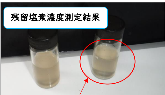
残留塩素濃度測定結果