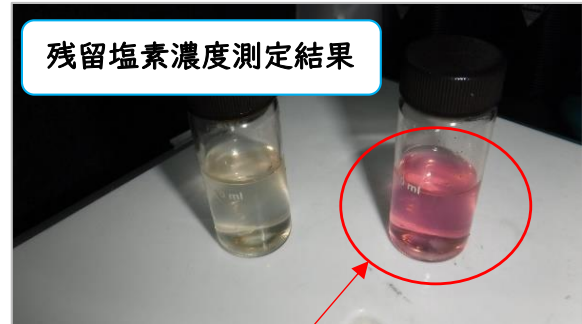
残留塩素濃度測定結果